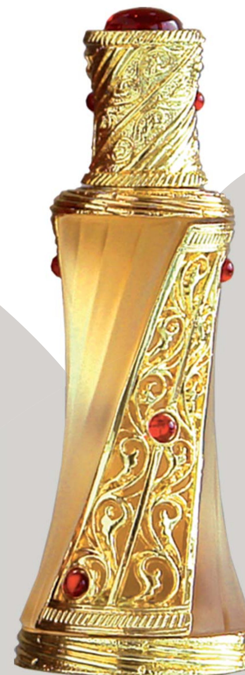
Attar Olie. Een parfum zonder alcohol. Pakistan, 2010.