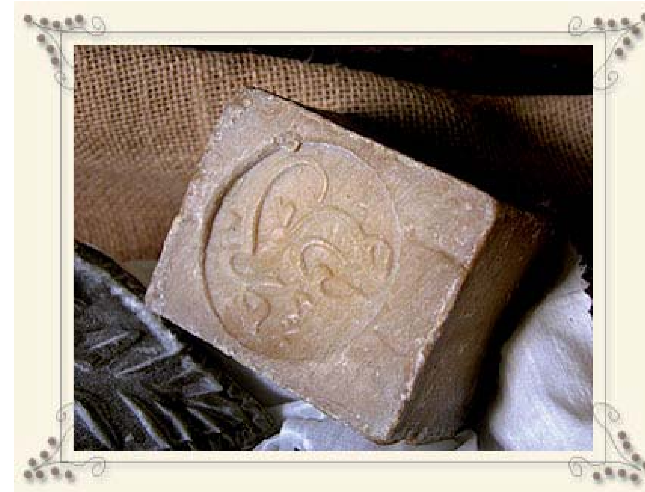
Handgemaakte Zeep. West Africa.

Ze waren complexer en sterk voorzien van aroma's(parfums). Het ontstaan van shampoo vond plaats in Mughal India. Shampoos werden vaak in combinatie gebruikt met oliën, zoals kokosolie.